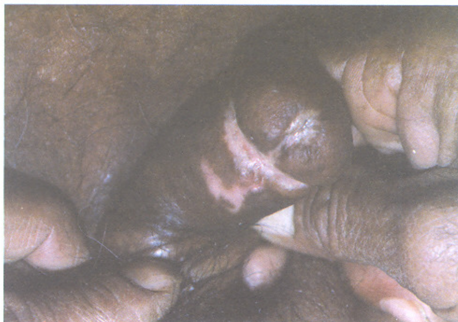
تصویر شماره ۲ - پلاک اسکروتیک سفید رنگ شفت پنس