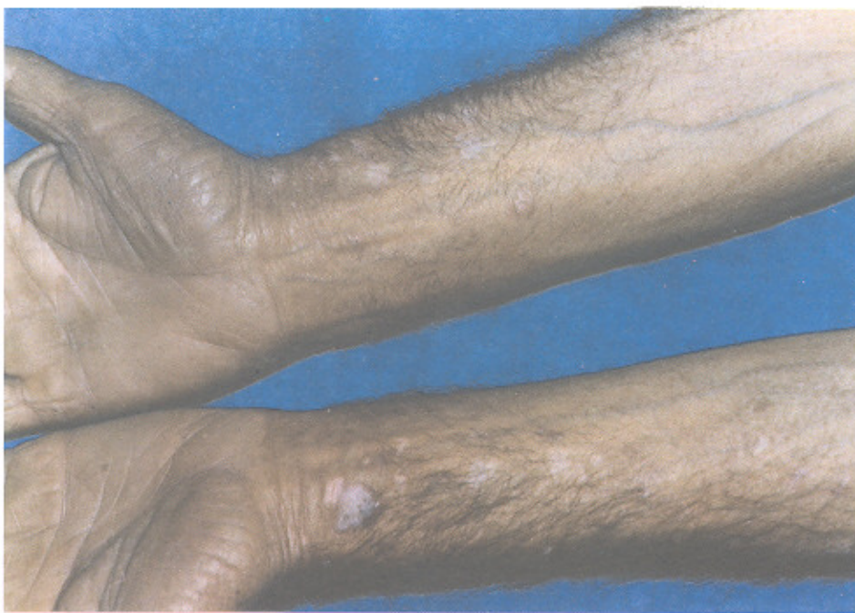
تصویر شماره ۳- پاپول و پلاک‌های بنفش رنگ خارش دار در ناحیه فلکسور میچ دست‌ها