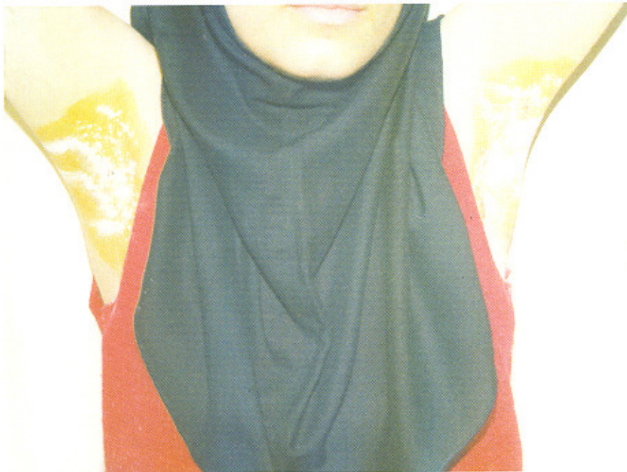
شکل شماره ۲: توقف تعریق پس از درمان (آنهیدروز) که با تست ید-نشاسته رنگ آبی تیره حاصل نشده است. رجوع شونده صفحه ۱۱ (شکل ۲)